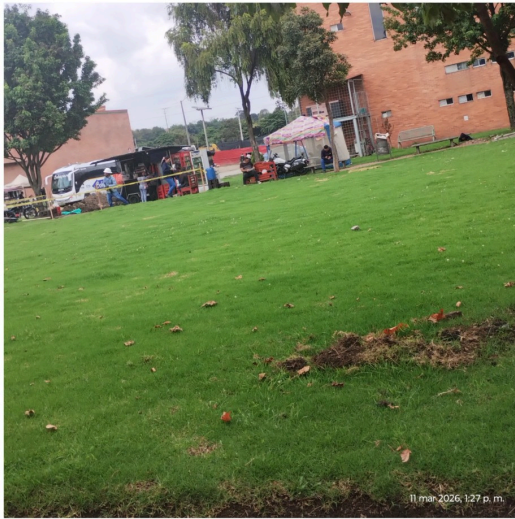
11 mar 2026, 1:27 p. m.