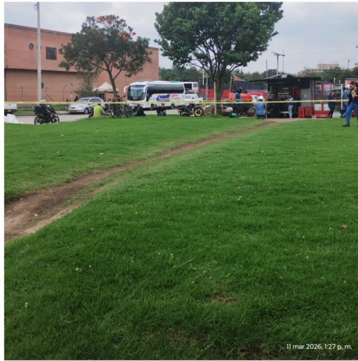
11 mar 2026, 1:27 p. m.