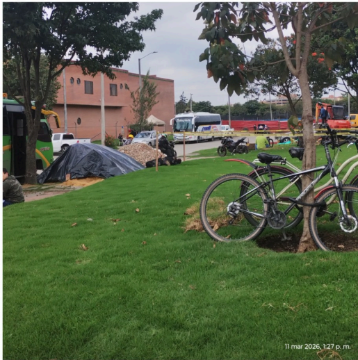
11 mar 2026, 1:27 p. m.