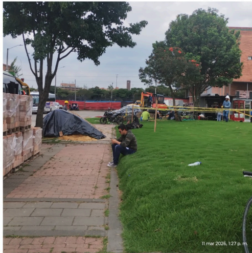
11 mar 2026, 1:27 p. m.